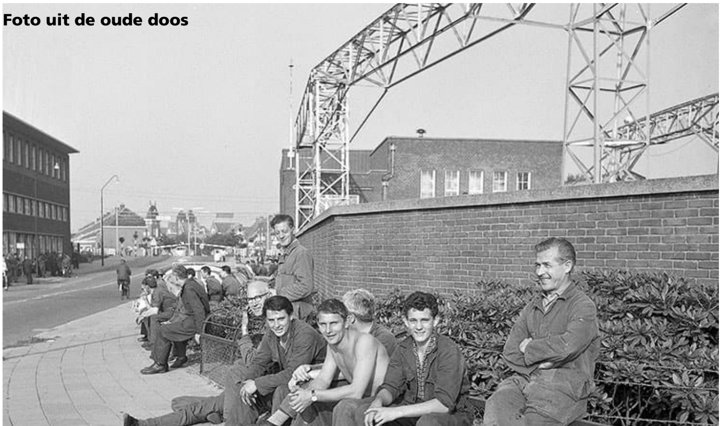
Foto: Oude industriegebied waar nu de Vlietkaap te vinden is