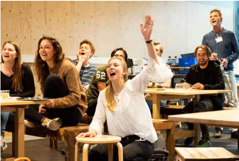
Uitreiking van de Meesterchallenge