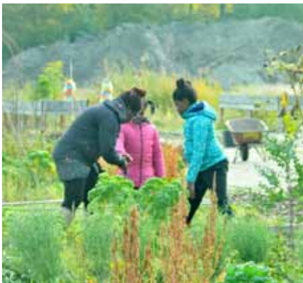
Drie mensen in de tuin 2018