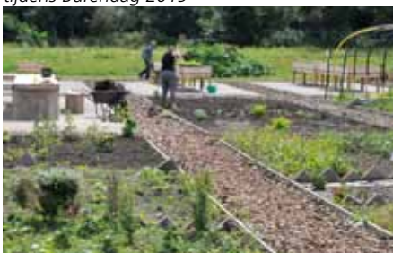
Overzicht van de Schanstuin